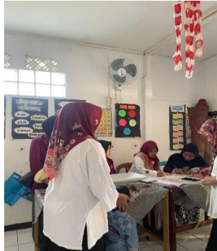
Gambar 2. Dokumentasi kegiatan pelayanan posyandu di Posyandu Kenanga Edukasi dan Perubahan Perilaku

Pelaksanaan kegiatan menunjukkan partisipasi aktif dari masyarakat, khususnya pada kegiatan posyandu, senam bersama, serta Minggu Bebersih. Setiap posyandu di tiga dusun (Kenanga, Rafflesia, dan Melati) mencatat rata-rata kehadiran 50–70 balita per sesi, dengan cakupan pemberian vitamin A sebesar 92%. Partisipasi ini membuktikan bahwa keterlibatan langsung mahasiswa KKN mampu meningkatkan kesadaran dan kepedulian masyarakat terhadap layanan kesehatan anak (Ahmad Saufi dkk., 2024).