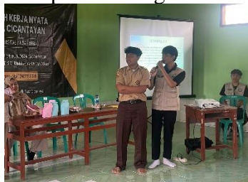
Gambar 4. Seminar pencegahan stunting dan kesehatan mental di MA Yaspi Cicantayan

Di tingkat remaja, seminar pencegahan stunting dan kesehatan mental di MA Yaspi Cicantayan diikuti oleh lebih dari 120 peserta dengan diskusi interaktif.