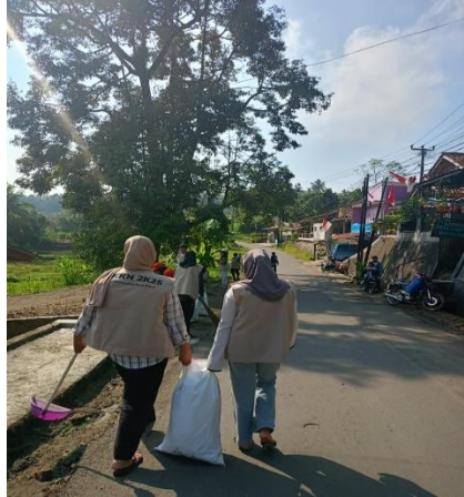
Gambar 5. Dokumentasi kegiatan Minggu Bebersih bersama warga Desa Cicantayan (masukin foto kerja bakti di sini)