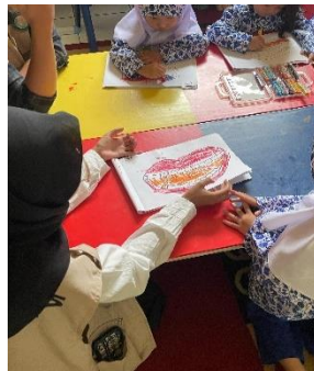
Gambar 3. Edukasi Perilaku Hidup Bersih dan Sehat (PHBS) di PAUD Cicantayan

Kegiatan edukasi PHBS di PAUD Cicantayan mendapat respon positif. Guru melaporkan adanya peningkatan kebiasaan anak untuk mencuci tangan dengan sabun.