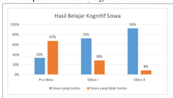
Gambar 1. Grafik Hasil Belajar Kognitif Siswa

Berdasarkan data hasil tes dan observasi siswa dilakukan perhitungan skor pada setiap siklus. Hasilnya dapat di lihat pada tabel dan diagram berikut.