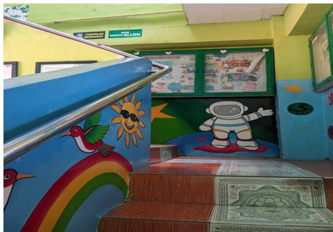
Alat bantu besi pegangan