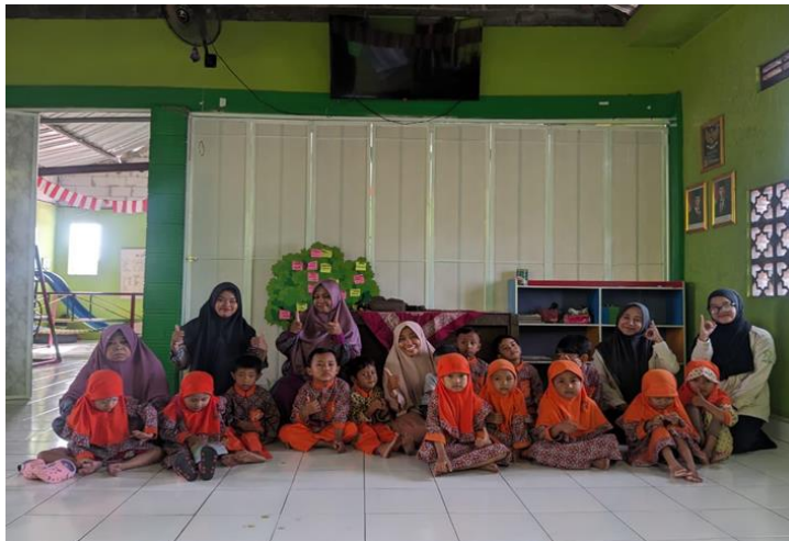
Foto bersama murid dan guru