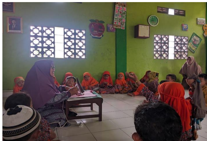
Pembelajaran Activity Daily Living