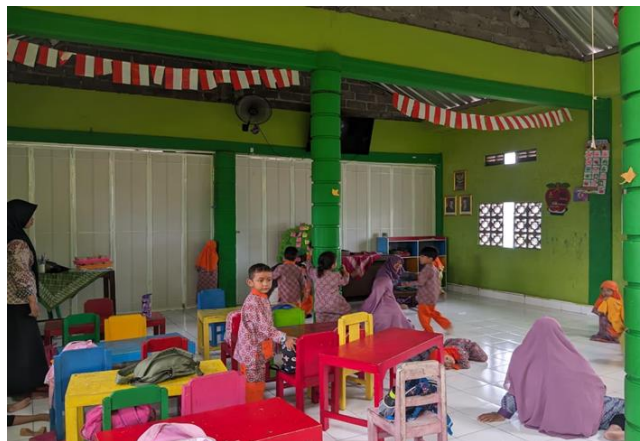
Suasana kelas inklusi