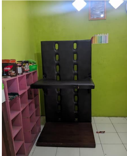
Standing Frame/ Standing Table