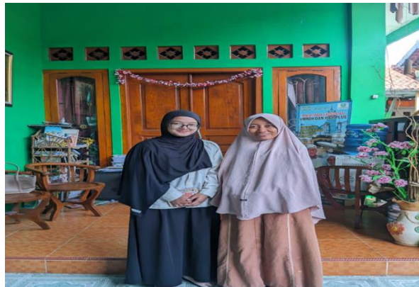
Foto bersama kepala sekolah