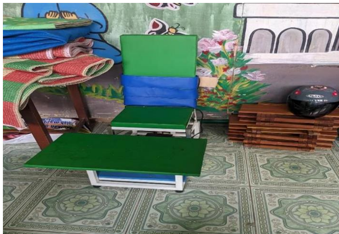
Cerebral Palsy Chair