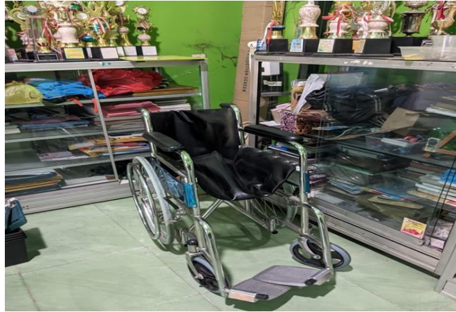
Alat bantu kursi roda